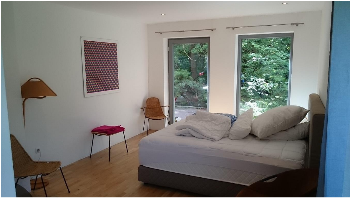
6 Gästezimmer mit Bad